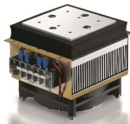
【サーモモジュール 標準アセンブリ品】

また、直流電源の極性を入れ替えると、この現象が逆転し、逆方向に熱の移動を行いますので、同じ面で冷却・加熱のいずれの目的にも使用することができます。その機能によりセンサー・制御器と合わせて使用する事で精密な温度調節も可能となります。製品紹介 URL: https://ft-mt.co.jp/product/electronic_device/thermo/