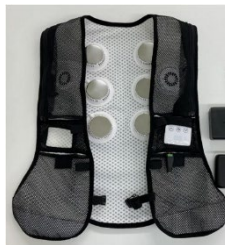
【左：サーモモジュール 標準アセンブリ品 / 右：サーモモジュール応用製品】